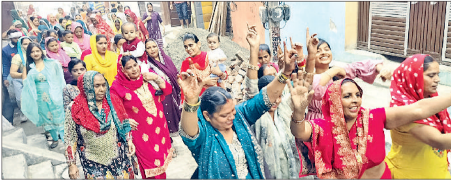
पानीपत। तुलसी विवाह शोभायात्रा में नृत्य करती हुई महिला श्रद्धालु।

श्री विश्वकर्मा मंदिर हरि सिंह कॉलोनी में महिला संकीर्तन मंडल द्वारा तुलसी विवाह करवाया गया। जबकि भंडारे की व्यवस्था श्री विश्वकर्मा पांचाल सभा द्वारा की गई। वहीं, श्री विश्वकर्मा मंदिर हरि सिंह कॉलोनी से शोभा यात्रा निकाली गई। शोभा यात्रा में डीजे की धुन पर भजनों पर झूमते हुए श्रद्धालु शामिल रहे। महिला संकीर्तन मंडल में केला