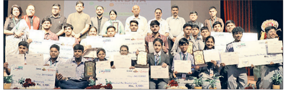
समालंखा। पाइंट में अतिथियों के साथ नेशनल स्पर्धा आइडियार्थों के विजेता विद्यार्थी।

एआई से आपके बच्चों की प्रतिभा का पता चलेंगा। एआई ही निर्धारित करेंगे कि बच्चे को किस क्षेत्र में करियर बनाना चाहिए। इसी तरह एआई के माध्यम से देश में आतंकी हमलों को रोका जा सकता है। ये प्रोजेक्ट यहां पानीपत इंस्टीट्यूट ऑफ इंजीनियरिंग एंड टेक्नोलॉजी (पाइंट) में नेशनल स्पर्धा आइडियार्थों में स्कूलों बच्चों ने दिखाए। सौ से अधिक स्कूलों ने इसमें भाग लिया। स्टार्टअप हरियाणा