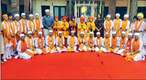
तरावड़ी। कार्यक्रम में भाग लेते प्रताप स्कूल के बच्चे।

गुरुनानक देव जी की शिक्षाएँ केवल धर्म का उपदेश नहीं, बल्कि जीवन का दर्शन हैं। उन्होंने सिखाया कि सच्चा इंसान वही है जो सत्य बोले, कर्म करे और दूसरों की सेवा में आनंद पाए। गुरु जी के बताये मार्ग पर चलते हुए मेहनत, निष्ठा से काम करें