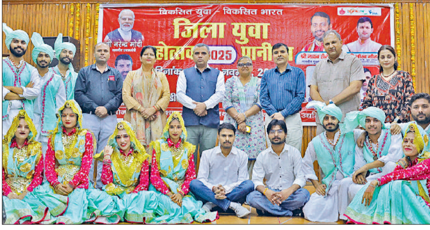
पानीपत। एसडी कॉलेज में अतिथियों के साथ सांस्कृतिक कार्यक्रम पेश करने वाले विद्यार्थी।

एसडी पीजी कॉलेज पानीपत में युवा अधिकारिता एवं उद्यमिता विभाग हरियाणा सरकार द्वारा प्रायोजित तथा राजकीय औद्योगिक प्रशिक्षण संस्थान पानीपत एवं जिला प्रशासन के सौजन्य से दो दिवसीय जिला युवा महोत्सव का शानदार समापन हो