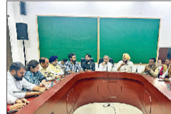
अंबाला। मीटिंग में मौजूद सीएम के ओएसडी व प्रशासनिक अधिकारी।

पंचकूला श्री नाड़ा साहिब गुरुद्वारा से यात्रा शुरु होगी जो कि अंबाला में नारायणगढ़ होते हुए दाखिल होगी। यह यात्रा 15 नवंबर से 22 नवंबर तक अंबाला में रहेगी। सिंह मंगलवार को पंचायत भवन अंबाला शहर के सभागार में जिला प्रशासनिक अधिकारी एवं हरियाणा सिक्ख गुरुद्वारा प्रबंधक कमेटी के पदाधिकारियों व सदस्यों के साथ एक बैठक ले रहे थे।