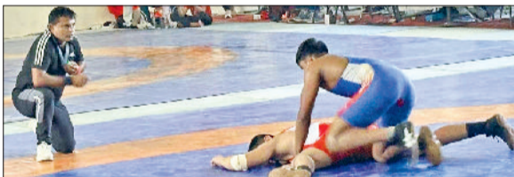
पानीपत। राष्ट्रीय कुशती में मुकाबलांतर दो पहलवान।

आर्य पीजी कॉलेज में आयोजित 69वें राष्ट्रीय कुशती अंडर 19 खेलों के चौथे दिन मंगलवार को पहलवानों के बीच रोमांचक मुकाबले हुए। लड़कियों के 50 व 55 किलो भार वर्ग तथा लड़कों का 74 व 79 किलो भार वर्ग में पहलवानों ने अपना दमखम दिखाया। लड़कियों के 50 किलो भार वर्ग में कुल 22 टीमों ने भाग लिया। सेमीफाइनल में महाराष्ट्र ने उत्तर प्रदेश को तथा हरियाणा ने हिमाचल प्रदेश को हराया। जबकि फाइनल में हरियाणा ने महाराष्ट्र को