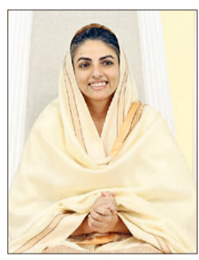
कल्याण की दिशा में अग्रसर होने का दिव्य संदेश देते इस पवित्र समागम का प्रेमाभक्ति के गरिमामय वातावरण में समापन हुआ। इधर, मां सुदीक्षा ने कहा कि मन को परेशान