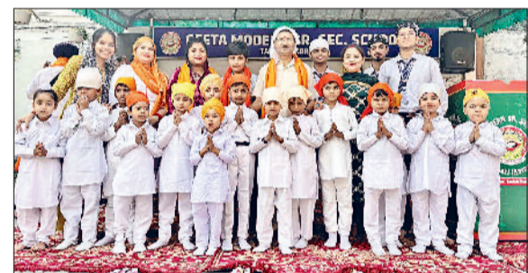
तरावड़ी। कार्यक्रम में भाग लेते गीता स्कूल के बच्चे।