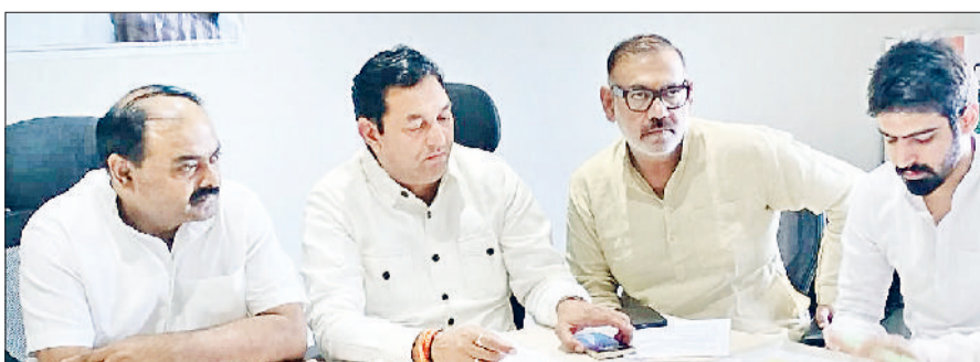
पानीपत। प्रेस वार्ता करते हुए भाजपा नेता।

अग्रदूत सरदार पटेल की 150 वीं जयंती को रन फॉर यूनिटी एवं आत्मनिर्भर भारत संकल्प