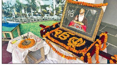
करनाल। दून इंटरनेशनल स्कूल सजा गुरु नानक देव का तख्त दरबार।