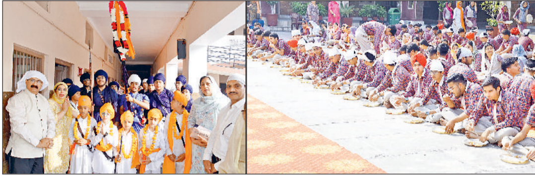
अंबाला। स्कूल में प्रभातफेरी निकालते व लंगर छकते छात्र।