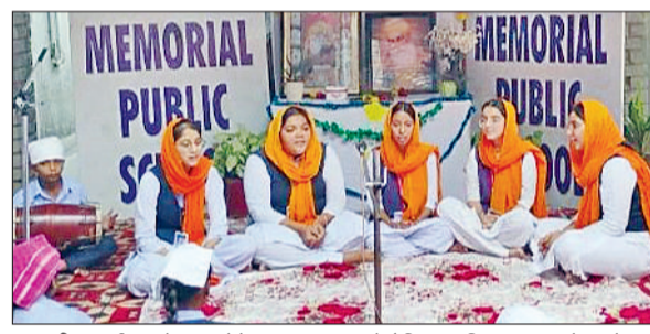
तरावड़ी। कार्यक्रम में भाग लेते एस.एम.एस. मेमोरियल पब्लिक स्कूल के बच्चे।